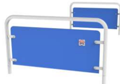
Type C - Encadrement métallique, revêtement en poudre avec panneaux HPL, amovible