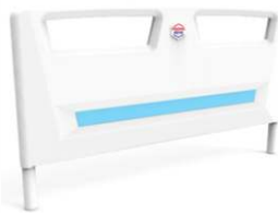
Type HB11 - en plastique, amovible