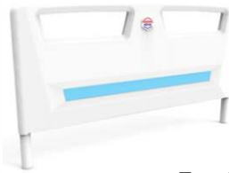
Type HB11 - en plastique, amovible