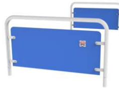
Type C - Encadrement métallique, revêtement en poudre avec panneaux HPL, amovible